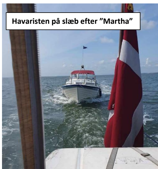
Havaristen på slæb efter "Martha"

Vi har en kraftig stigning i familie/firmature fra Esbjerg Strand, derfor har vi besluttet at forhøje prisen til 2.500 kr., når der skal afhentes i Esbjerg. Det tager en halv time hver vej.