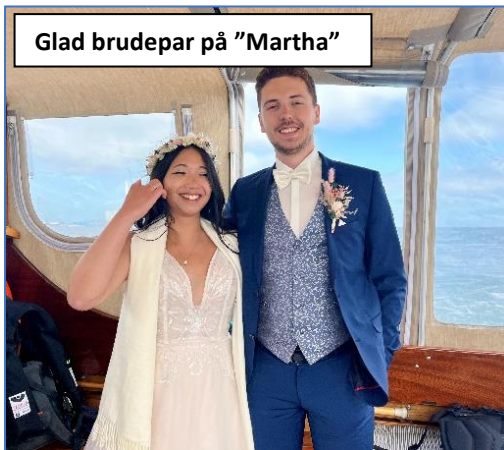
Glad brudepar på "Martha"

Vi har haft usædvanlig travlt – også i år 😊 Vi sejlede rigtig mange urner i sæsonens første måneder, og gør det stadig, i gennemsnit en gang om ugen.