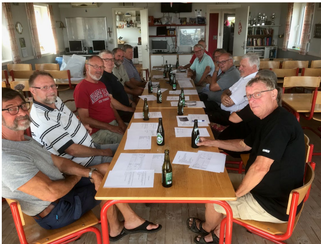
Møde i bådgruppen 2. august 2019

Det er planen at Martha blandt meget andet også skal sejle Rutesejlad Sønderho-Ribe med turister i 2020, når sejlrenden til Sønderho er blevet uddybet. Men vi satser meget på at kunne sejle rigtig mange havnerundfarter i Esbjerg havn, hvor vi har fået tilladelse til at sejle i alle bassiner.